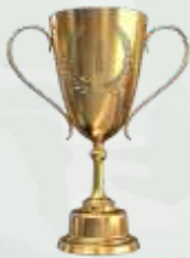
TRHOPY JUARA I

Perhitungan juara umum diambil dari akumulasi perolehan medali Emas.